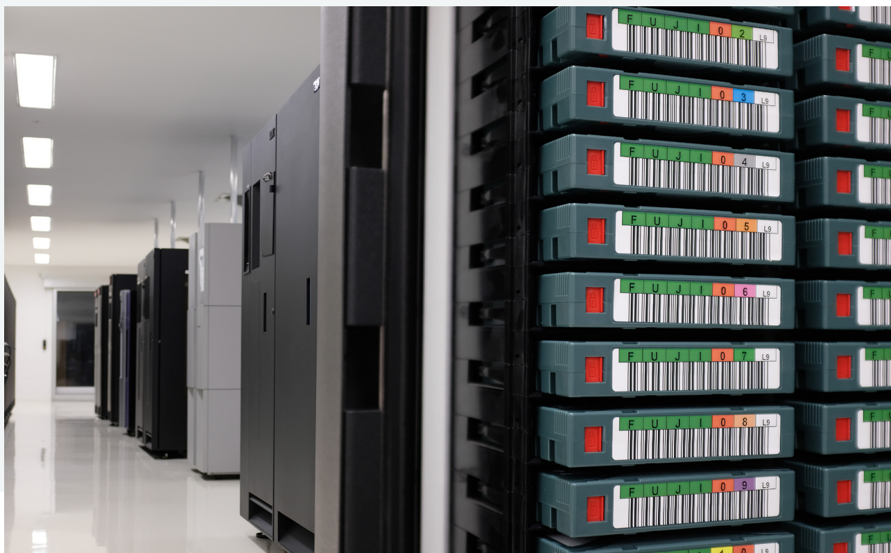
Cintas LTOg en un datacentre